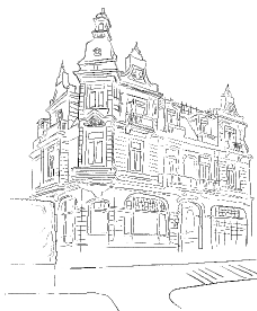
Strandweg 13 22587 Hamburg