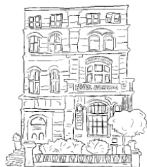
Heimhuder Straße 16 20148 Hamburg